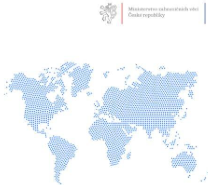
Mapa globálních oborových příležitostí