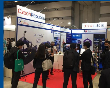
Český stánek na veletrhu virtuální reality v Tokiu VR/AR/MR World 2021